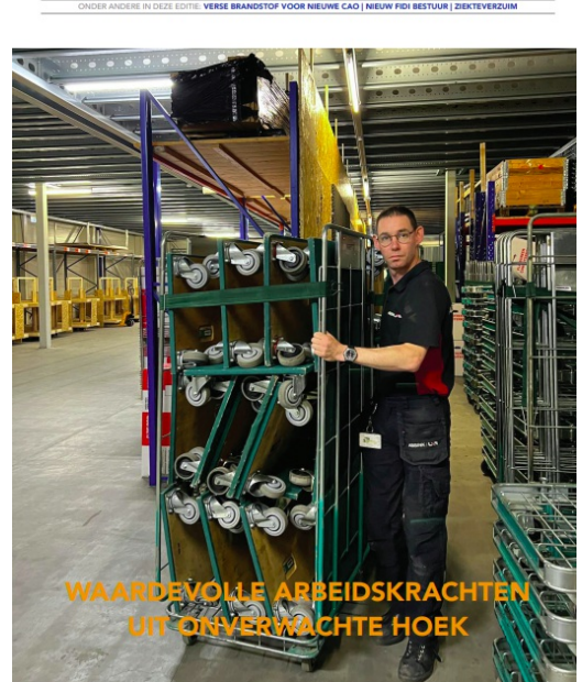
WAARDEVOLLE ARBEIDSKRACHTEN UIT ONVERWACHTE HOEK