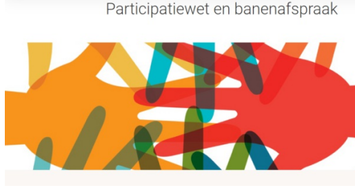
Participatiewet en banenafpraak

In verschillende gemeenten lijkt een situatie te ontstaan waarbij werkgevers geen loonkostensubsidie meer krijgen voor het volledige aantal uur dat hun medewerkers werken.